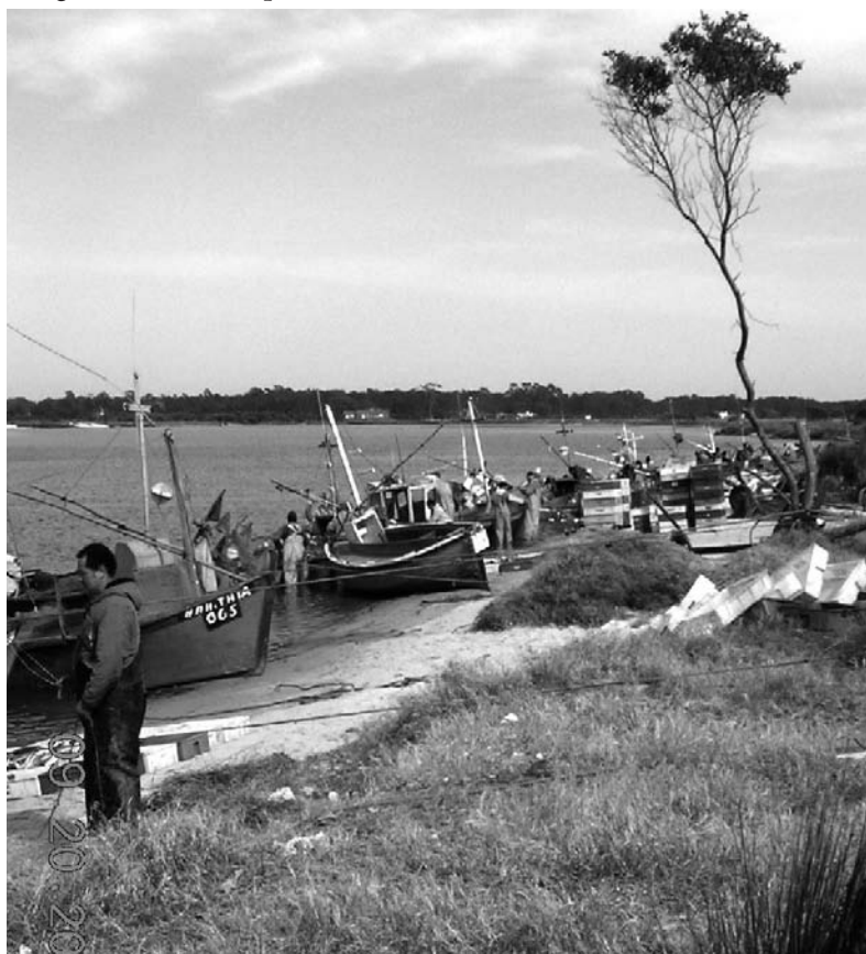
Pescadores en el Arroyo Pando durante el 2006.

Esta concentración de personas vinculadas a la pesca artesanal generó que algunos vecinos plantearan formalmente quejas, particularmente por ruidos en la madrugada, el tráfico de camiones y rotura de calles, ubicación de barcas en predios privados, “conductas inapropiadas”, pérdida del margen del río como paseo recreativo consecuencia del amarre de barcas